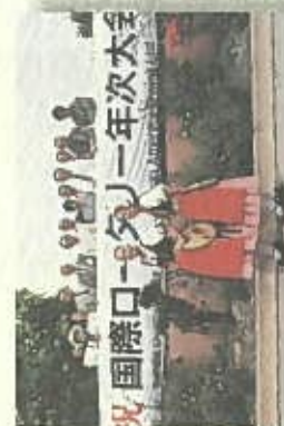
1985年6月ニースでの国際大会に参加。坂部ガバナーノミニと一同記念写真。とても楽しいミス・トラスト・ル・フランスでした。