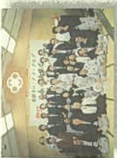
星の丘産産での楽しい思い出の集まりの様子。