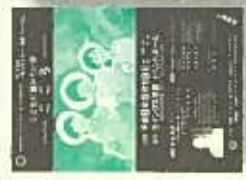
1996年5月18日ウィングス京都において青少年育成フォーラムを開催。