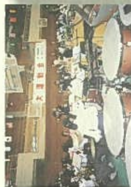
第2回京都府県連合会(秋の大会)は京都府府民スポーツセンターにて開催。アトラクションでは高野中学体育系部が元氣いっぱい演奏を披露してくれました。